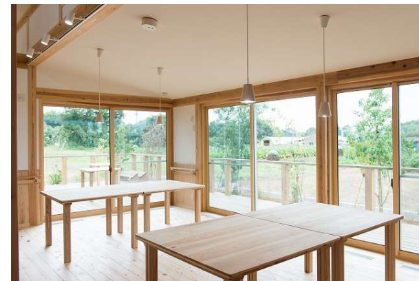
フレンズ印西デイサービスセンター 食堂