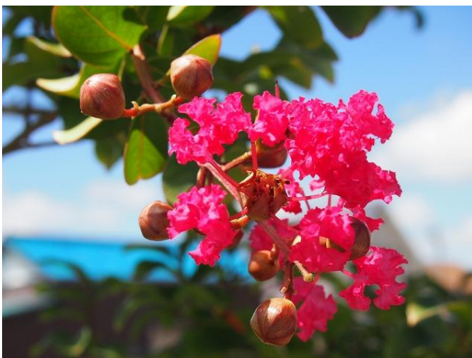
フレンズの遊歩道には百日紅(さるすべり)が咲きました。